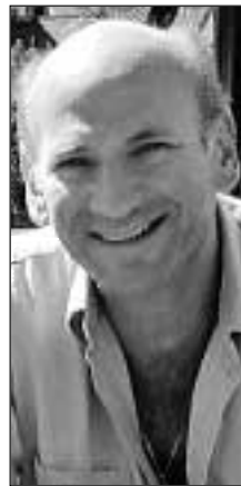
— Jeg må ha verdensrekord i å skifte plateselskap.

— Musikk er et redskap for å oppnå dette. Som musikere er vi en slags budbringere. Musikken er ren, den har ingen følelse; der er ikke pen, stygg, god, dårlig, hatfull eller kjærlig. Jeg mener musikk er reiner enn noen annen kunstform. Det er bare lyd, du kan ikke en gang sette fingeren din på den, musikken er uskyldig. Men den er fortsatt bare et redskap.